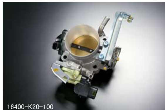
S2000 F20C (AP1)