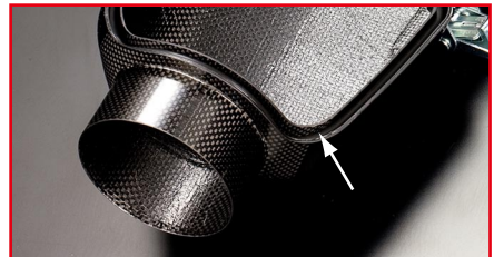
気密性保持、そして振動破損防止に、O-ring シールを採用。