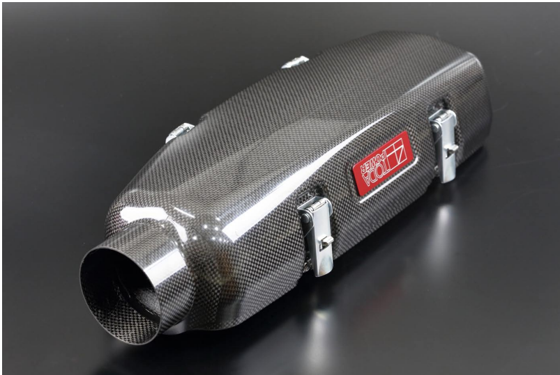
入り口外径が80mm、入り口内径は77.5mmで設計されています。 (重量)750g

TODA BP (マツダ ロードスター NA8C / NB8C) スポーツインジェクション用 ドライカーボンサーージタンク